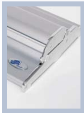
Die versenkten Schraubköpfe beim Roll Up Professional unterstützen das exklusive Design.